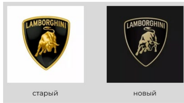
Рисунок 2 – изменения логотипа Lamborghini

В качестве обширного примера корректировок логотипа можно привести компанию Netflix, логотипы которой представлены на рисунке 3. Они вносили изменения несколько раз. И так, впервые компания полностью изменила логотип в 2000 году, по причине того, что изначально он получился неудачным и уже не отвечал трендам рынка. Следующие небольшие корректировки были внесены в 2014 году, когда компания сменила стратегию развития и именно эти внутренние изменения Netflix захотели отразить в своём новом логотипе.