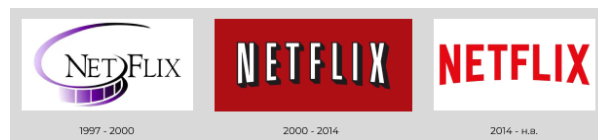
Рисунок 3 – изменения логотипа Netflix

В качестве обширного примера корректировок логотипа можно привести компанию Netflix, логотипы которой представлены на рисунке 3. Они вносили изменения несколько раз. И так, впервые компания полностью изменила логотип в 2000 году, по причине того, что изначально он получился неудачным и уже не отвечал трендам рынка. Следующие небольшие корректировки были внесены в 2014 году, когда компания сменила стратегию развития и именно эти внутренние изменения Netflix захотели отразить в своём новом логотипе.