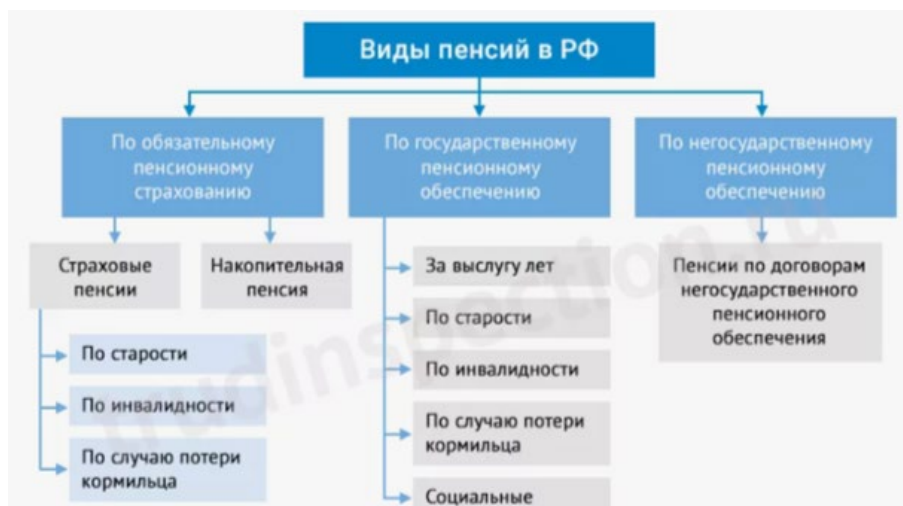
Рис.1. Модель пенсионной системы Российской Федерации.

В Российской Федерации модель действующей пенсионной системы является распределительно-накопительной. Более наглядно действующая модель пенсионной системы России представлена на рисунке 1.